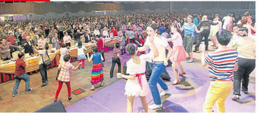
熱鬧、歡樂的開場復古風舞蹈，為年宴掀開序幕。