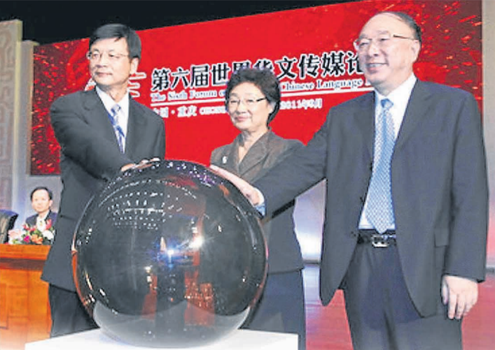
国务院侨办主任李海峰(中)、重庆市市长黄奇帆(右)与中国新闻社长刘北宪一同为论坛开幕。