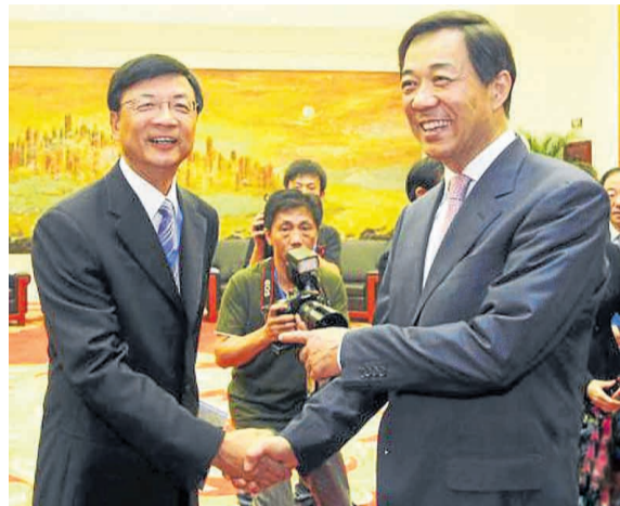
中共重庆市委书记薄熙来(右)会见中国新闻社长刘北宪。

最重要的新闻资源。西方媒体对中国事务的报道始终热情不减,大量的基本事实可以改变媒体人的部分偏见,西方媒体对中国的报道近年来趋于客观、平实,但仍经常发生严重误读。